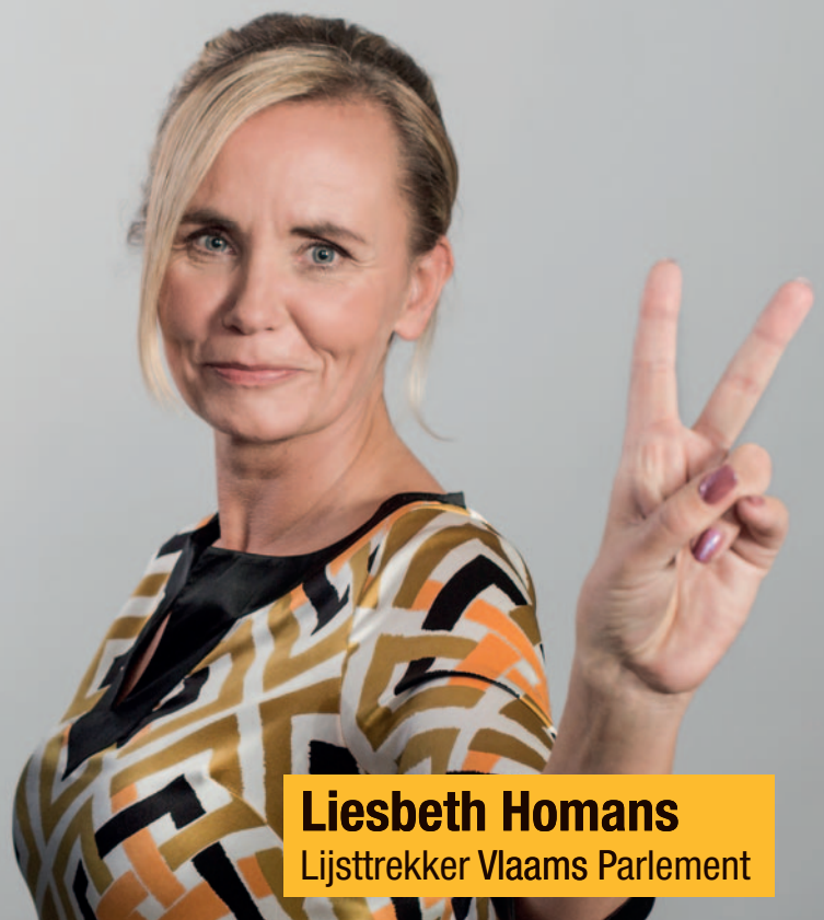
Liesbeth Homans Lijsttrekker Vlaams Parlement

Als burgemeester zoek ik elke dag oplossingen voor de mobiliteitsknoop, voor de leefbaarheid van de stad en het welzijn van iedereen die spaart, werkt en onderneemt. Maar zolang we België niet hervormen, staan we machteloos tegenover de hoge belastingen, de faillissementengolf, de verwistende structuren.