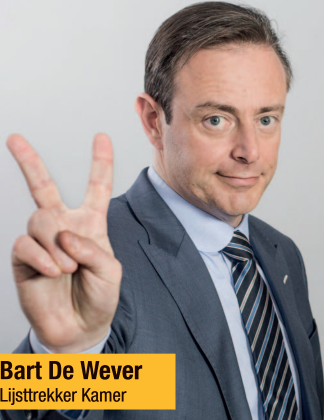
Bart De Wever Lijsttrekker Kamer