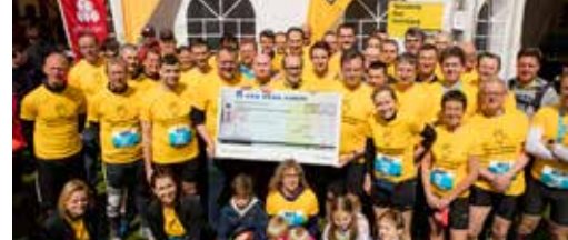
Loop samen met de N-VA de 10 Miles p. 3