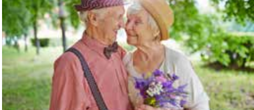
Actieve senioren in Merksem p. 2