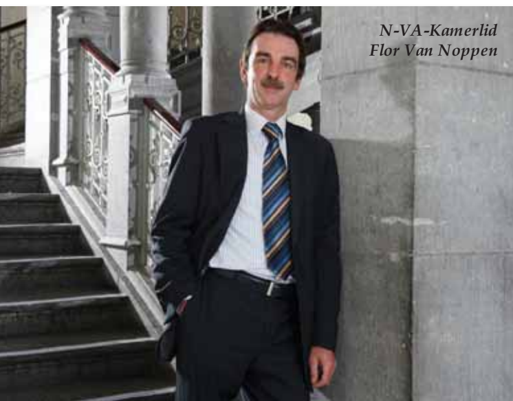
N-VA-Kamerlid Flor Van Noppen

Hoewel het Antwerpse stadsbestuur haar zegen gaf om maatregelen toe te passen die het slachten onder verdoving moesten bevorderen werd het de Antwerpse moslims omwille van een administratieve fout toch toegestaan om hun dier zonder verdoving te laten slachten.