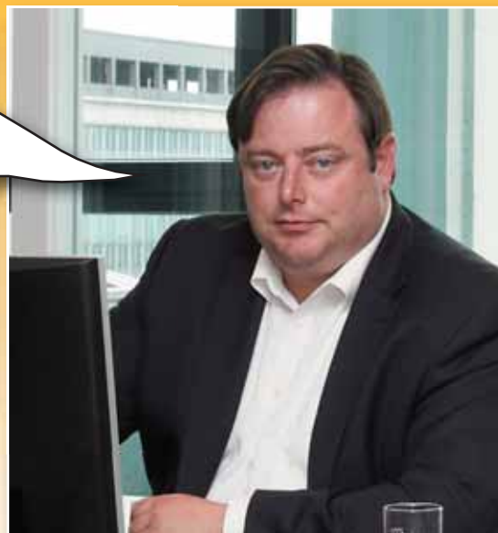
N-VA-VOORZITTER BART DE WEVER