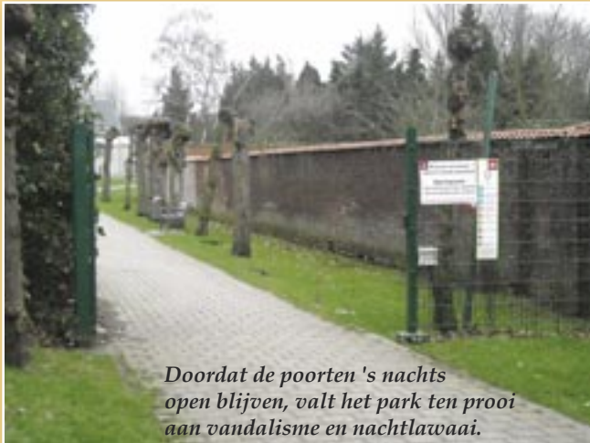
Doordat de poorten 's nachts open blijven, valt het park ten prooi aan vandalisme en nachtlawaai.

Een aantal bewoners van de appartementsgebouwen die uitkijken over het Runcvoortpark zijn uitermate bezorgd over de plannen van het districtscollege om de poorten van het park in de toekomst ook 's nachts open te laten.