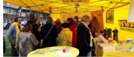
N-VA Buurt met Bart De Wever (p. 2)