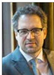
Koen KENNIS , Antwerps schepen voor Mobiliteit

Vanaf 1 januari 2019 wordt het bewonersparkeren in ons district uitgebreid. De zone ten zuiden van de Groenedaallaan, van Winterling tot de Carrettestraat, wordt een blauwe zone. Ook in 't Dokske wordt het bewonersparkeren uitgebreid tot aan de Van Stralenlei. Bewoners met een bewonerskaart zullen er hun wagen onbepikt kunnen parkeren. Andere voertuigen kunnen gedurende maximaal twee uur parkeren. Op die manier komen we tegemoet aan de verhoogde parkeerdruk in deze buurten. In samenwerking met de stad zal er verder ook een parkeeronderzoek uitgevoerd worden in andere Merksemse buurten met verhoogde parkeerdruk, zoals onder meer ter hoogte van het Jan Palfijn Ziekenhuis en in de toekomst het uitgebreide P&R-gebouw aan Keizershoek.