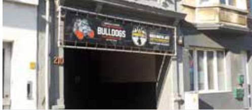
Stad wil uitbreiding The Bulldogs onderzoeken (p. 2)