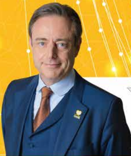
Bart De Wever Algemeen voorzitter

Engie passeert tweemaal langs de kassa. Door het uitstelgedrag van paars-groen kan het energiebedrijf extra veel geld vragen om de kerncentrales te verlengen. En daarbovenop ontvangt Engie van de regering ook nog eens gassubsidies. De belastingbetaler betaalt het gelag.