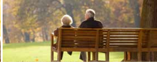
Premie voor Merksemse senioren (p. 5)