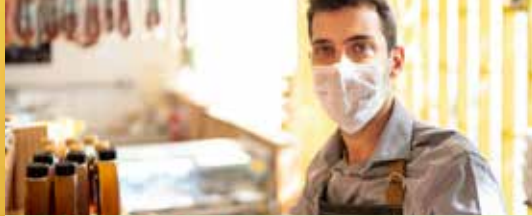
Steun voor Merksemse horeca (p. 2)