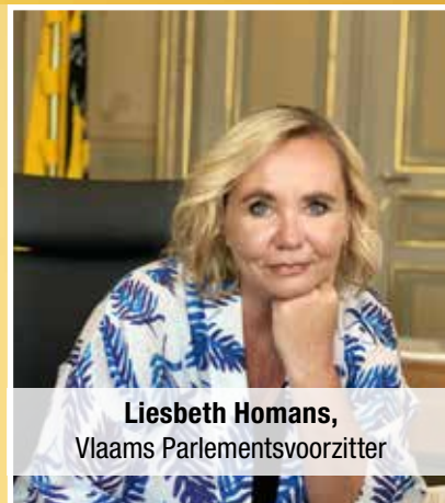
Liesbeth Homans, Vlaams Parlementsvoorzitter

In het één-programma ‘Over 5 jaar’ stelde VRT-journaalanker Wim De Vilder eind 2015 een reeks interessante vragen aan een aantal bekende mensen. Hoe zullen de wereld en ons land er over vijf jaar uitzien? En hoe zal je eigen leven er dan uitzien? De interviews van toen werden vijf jaar lang weggestopt. Niemand kon ze bekijken. Voor de negen gasten een reden om echt het achterste van hun tong te laten zien. Ook Liesbeth Homans werd in 2015 geïnterviewd door Wim De Vilder. Vijf jaar later blikte zij samen met hem terug op haar uitspraken van toen. En dat leverde behoorlijk verrassende televisie op.