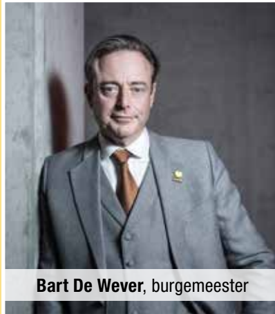
Bart De Wever, burgemeester

“In de strijd tegen drugsgeweld doe ik wat ik moet doen als burgemeester: de veiligheid van alle Antwerpenaars bewaken en zorgen dat onze straten niet het decor worden voor afrekeningen van de drugsmafia. Met Operatie Nachtwacht controleert de politie iedereen die 's nachts in de getroffen wijken op straat komt. Dat leidde al tot een 50-tal arrestaties en de politie nam auto's, wapens, drugs en cash geld in beslag. Mijn oproep aan de nieuwe federale regering: neem ook uw verantwoordelijkheid en bestrijd de internationale georganiseerde misdaad met meer middelen en mankracht.”