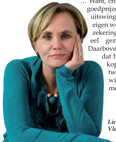
Liesbeth Homans Vlaams parlements lid

Hier moet iets aan gedaan worden. Het kan niet zijn dat men benadeeld wordt omdat men in de stad wil wonen. Vandaar dat we in het Vlaams Parlement en op stadsniveau alle premies én de toekenningsvoorwaarden onder de loep zullen nemen zodat deze aangepast kunnen worden aan de noden van vandaag. Zodat wonen in de stad niet langer financieel bestraft wordt.