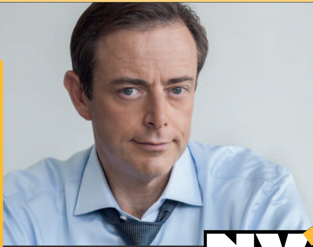
Bart De Wever Algemeen voorzitter N-VA

Op 14 oktober stemde heel Vlaanderen krachtig voor verandering. De N-VA haalde dan ook een knap resultaat. Zo komt er verandering in de Dorpsstraat. Blijft nu nog de Wetstraat. Want CD&V, sp.a en Open Vld zijn in de regering-Di Rupo echt niet goed bezig. Dat merkt u aan zowat alles. De N-VA zet uw vraag naar verandering daarom nu al centraal op de verkiezings-agenda van 2014.