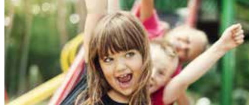
Nieuw speelterrein Fort van Merksem p. 2