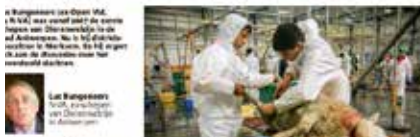
N-VA in de bres voor dieren p. 2