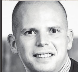
● Liesbeth Homans is fractieleider Senaat en Vlaams Parlementslid N-VA